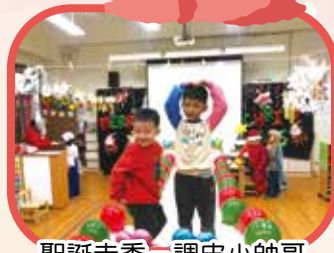
聖誕走秀-調皮小帥哥