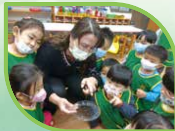
找找看蚯蚓在哪裡