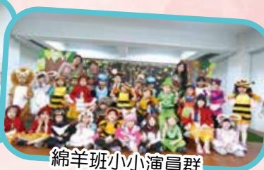
綿羊班小小演員群