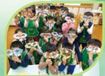
葉子面具-猜猜我是誰