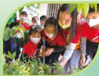
害羞的含羞草躲在這