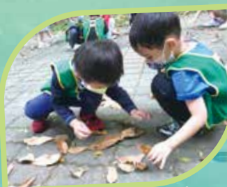
用葉子拼出毛毛蟲