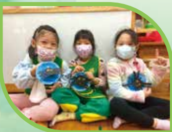
好忙好忙的蜘蛛結網

在「大自然的化妝舞會」主題中，孩子們在校園環境裡體驗生活的素材。例如：樹葉的四季變化與顏色之間的微妙關係；躲在草叢間的毛蟲、土裡的蚯蚓，是如何運用自身保護色在環境中求生存；樹上的鳥兒每天發出不同鳴叫聲，原來是呼喚同伴的暗號。這些生活素材的觀察與操作、認知概念的學習，可都是興化寶貝幸福ing的重要元素喔！