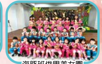
海豚班俊男美女團