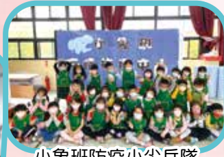
小象班防疫小尖兵隊