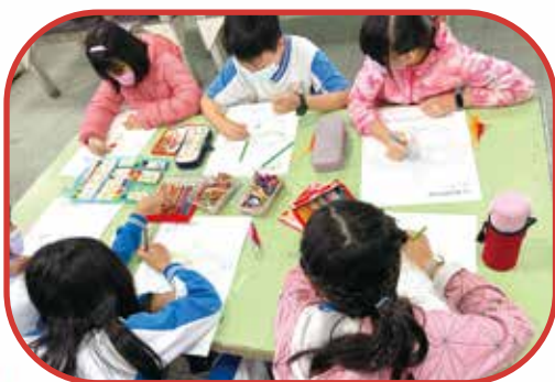
馬來西亞風箏彩繪

在課程教學過程中，透過影片與實物，介紹馬來西亞的文化特色，讓孩子們間接體會異國風情並擴展學習視野。而在彩繪過程中，孩子們均表示，風箏的色彩鮮艷、圖案抽象，和本國原住民的服裝及圖騰有異曲同工之妙。