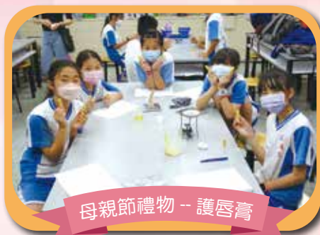
母親節禮物 - 護唇膏

能與大家一起進行有趣的活動，心情應該很開心吧！能讓你學習到不同的事物，相信你會做的更棒，謝謝你製作的禮物，護唇膏很實用喔！媽媽很喜歡，永遠愛你的媽媽