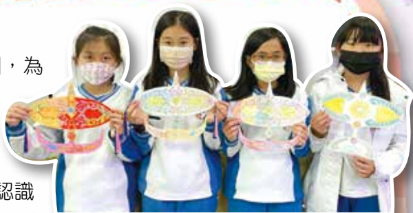
馬來西亞風箏吊飾作品

馬來西亞是一個位於東南亞的國家，其中吉蘭丹州，為傳統藝術的發源地，而傳統工藝中，馬來西亞人都會想到 Kelantan Wau (吉蘭丹風箏)。本校配合新北市 111 年校園多元文化週，特引進社會資源，與明志科技大學通識中心合作，結合藝術與人文課程，引導四年級學生認識馬來西亞風箏文化，進行風箏吊飾彩繪教學，一串串色彩鮮艷的作品，讓學生們愛不釋手。