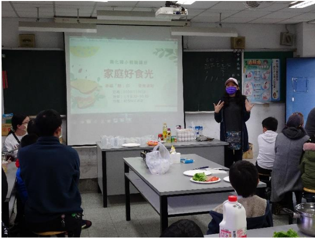
校長親臨與家長及孩子們共同製作美味早餐