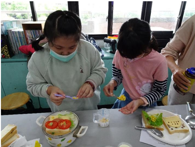
孩子們發揮創意製作三明治