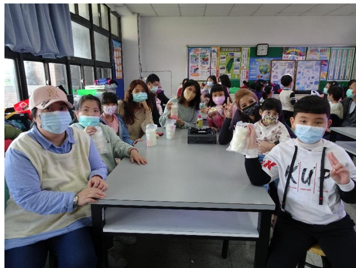
各家庭歡欣展示活動戰利品