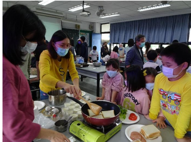
家長與孩子共同製作創意三明治