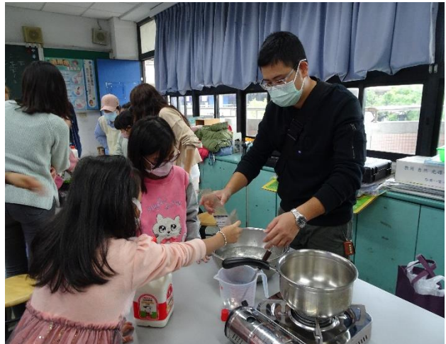
家長與孩子們認識吉利丁片溶解過程